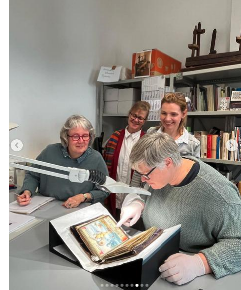
Post auf Instagram zu einem kostbaren Freundschaftsbuch.

Sprechen Sie Ihre Lokalzeitungen, Monatszeitschriften, Radio und TV frühzeitig an und laden sie diese bereits vor dem Tag der Restaurierung in Ihr Atelier, Depot oder auf Ihre Denkmalbaustelle ein. Dort kann die Lokalpresse bereits vor dem Ereignis Fotos machen oder drehen und durch Ankündigungen im Vorfeld für viele Besucher am Tag selbst sorgen. Je nach Medium ist für die Ansprache eine Vorlaufzeit von einem halben Jahr (bei Quartals- und Monatszeitschriften) bis zu zwei Wochen vor dem Termin sinnvoll. Eine Erinnerung wenige Tage vor dem Ereignis selbst ist immer eine gute Ergänzung zum ersten Anschreiben oder Anruf.